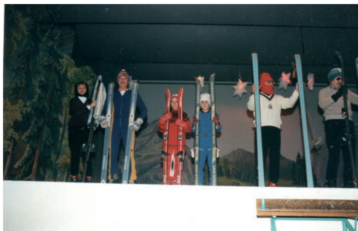
50 Jahre Skiclub – MZH Reigoldswil.

Zur Jahrtausendwende holt die Vergangenheit den Verein wieder ein. In seinem Jahresbericht bilanziert der Präsident die vielen Hochs und Tiefs der vergangenen 365 Tage. Er muss feststellen, dass es immer weniger Idealisten gibt, die sich an vorderster Front zur